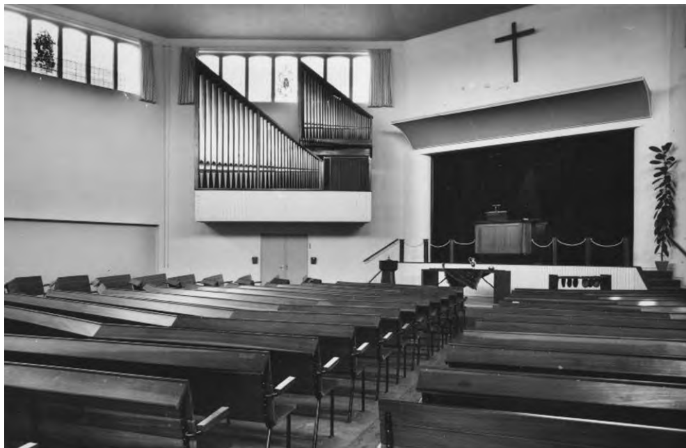
Voormalige gereformeerde kerk in Heerlen. Hier voerden wij het kerstspel op