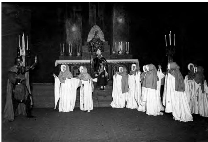
Toneelstuk Gysbrecht van Aemstel uitgevoerd door de Koninklijke Vereniging Het Nederlandsche Tooneel in de Stadsschouwburg in Amsterdam. Foto 1918: Rij van Klarissen/Clarissen

En altijd weer worden onschuldigen het slachtoffer. De nonnen in het Klaerissenklooster. De kinderen van Bethlehem. De joden in de Tweede Wereldoorlog. Onschuldige burgers, volwassenen en kinderen, in Syrië en andere landen, waar terreurgroepen actief zijn. De dood van, de gruwelijke moord op kinderen grijpt ons het meest aan. En dat gebeuren is door Vondel op aangrijpende wijze beschreven in dit lied,