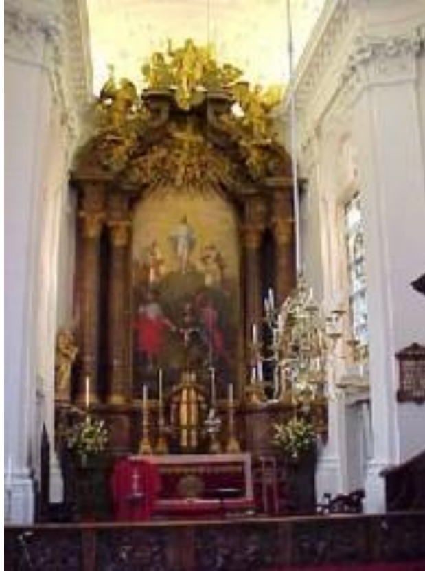
Altaarschilderij met de Verheerlijking op de berg (Matthias Terwesten 1733) Oud-Katholieke parochiekerk van Den Haag

En plotseling als hij in gebed is straalt Jezus als de zon, straalt hij goddelijk licht uit.