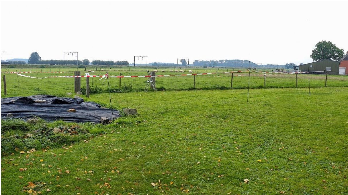
Het voormalige kloosterterrein in de buurtschap Essen bij Groningen: de omtrek van de kerk is met linten aangegeven.