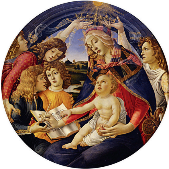
- Sandro Botticelli De Madonna van het Magnificat (1483).

aandurven, als wij tekenen durven op te richten van Gods toekomst waarin de wereld nieuwe aarde zal worden en alle vlees het heil zal aanschouwen, ja, dan zal ons Magnificat eerst echt een loflied worden, dan komt Maria ook op onze lippen waarlijk aan het woord.