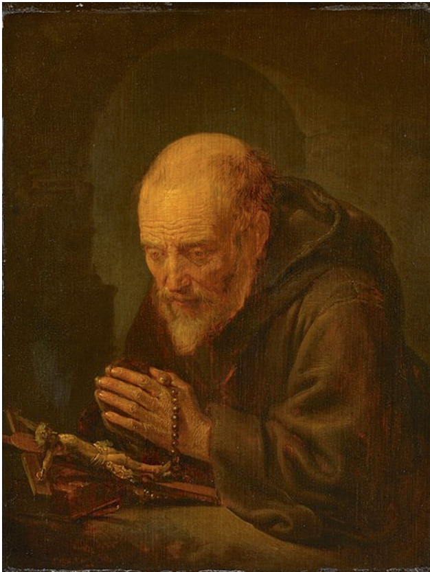
- Gerard Dou Een kluisenaar in gebed