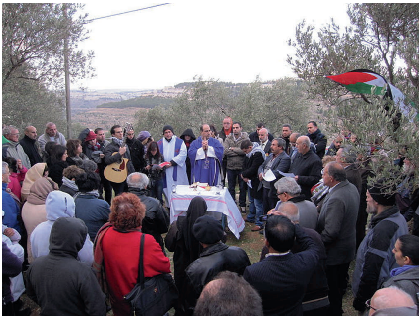
- Deelnemers aan een demonstratieve eucharistieviering in de open lucht. ccbysa/GFDL