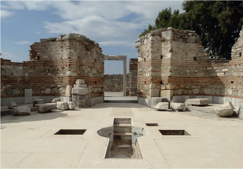
- Doopvont in de basiliek van de H. Johannes te Efeze

In Noord-Afrika – de leefomgeving van Augustinus - zijn bij opgravingen doopbassins uit de vijfde eeuw teruggevonden. In de ruïnes van de Johannesbasiliek in Efeze is nog steeds in het doophuis het doopbassin te zien en dat geeft een goede indruk hoe er in de eerst eeuwen gedoopt werd.