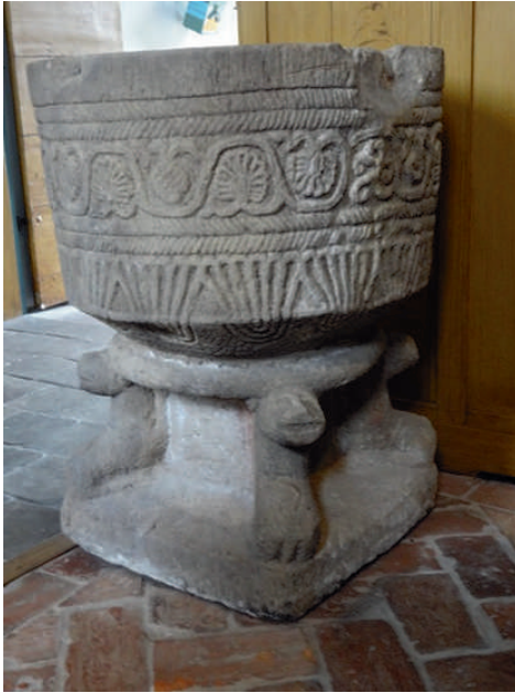
- Doopvont uit ca. 1250 in de protestantse kerk van Meeden

nog steeds gebruikelijk. Kijk maar naar de grote romaanse doopvonten afkomstig uit een aantal Groninger kerken.