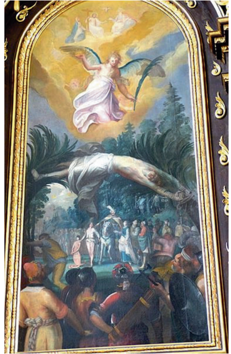
- Jakob Bendel, Het martelaarschap van de Heilige Corona - Wahlfahrtskirche Altarwand

Dinsdagavond dartzelde Corona nog over het veld bij FC Porto, die overwon in de Champions Ligue. En in de blauwe supermarkt zie ik al jaren Corona uitdagend in het bierschap staan, terwijl in het wijnschap bij de gele concurrent de wijn van het huis Corona mijn aandacht trekt.