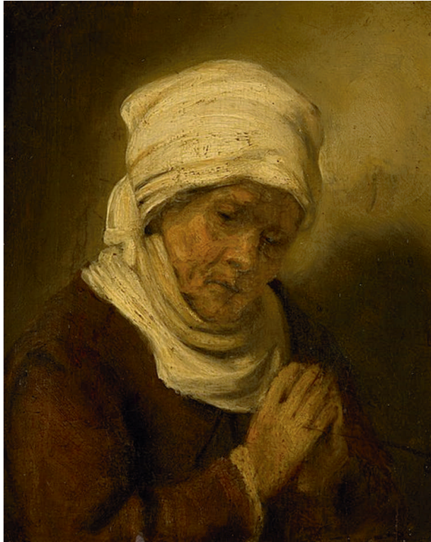
- Rembrandt - Biddende vrouw