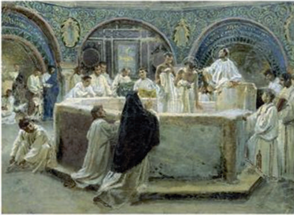
- Een romantische voorstelling van de doop van de H. Augustinus in de Paasnacht van 387 in de kathedraal van Milaan (het baptisterium waarin hij werd gedoopt is nog steeds te zien onder de dom van Milaan).

schaamden zich niet voor elkaar”. Zo werden we gezalfd, van kop tot teen, voortaan helemaal onder de invloed van de Gezalfdde.