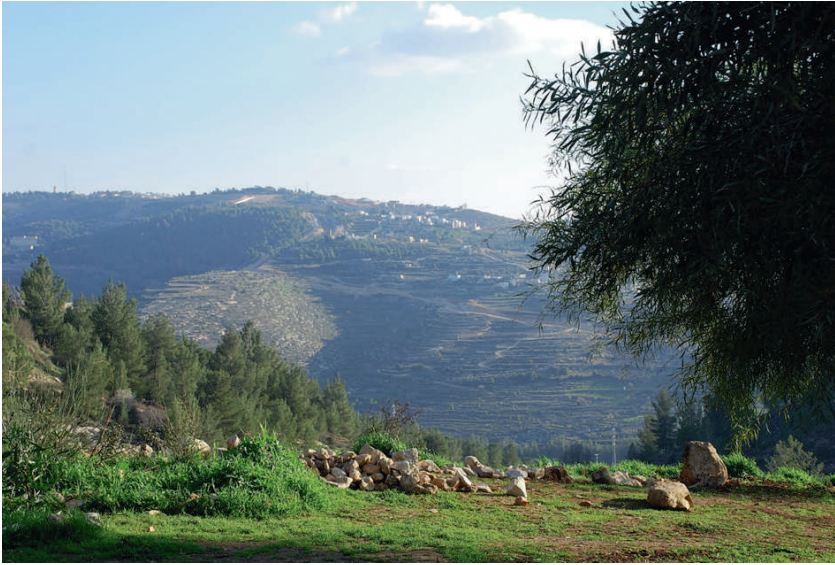
- De Cremisanvallei in betere tijden

de olijfbomen elders herplant zouden worden, maar vervolgens moesten ze toezien hoe de wortels ervan afgezaagd werden.