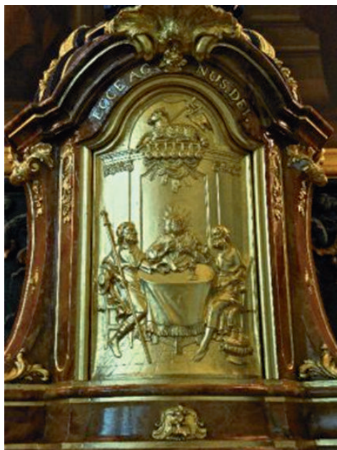
- Op de deur van het tabernakel in de Oud-Katholieke parochiekerk van Delft afbeeldingen van het Lam met de zeven zegels en de Emmaüsgangers aan tafel met de verzezen Heer die het brood deelt.

Dat gebeuren is vaak uitgebeeld. Bijvoorbeeld in mijn eerste parochie Amersfoort op een schilderij in het priesterkoor, in de kathedraal in Utrecht boven de deur naar één van de sacristieën, in de parochie Delft op de deur van het grote, vergulde tabernakel.