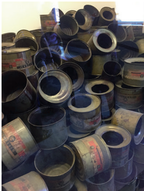
- Blikken met Zyklon B

Johan Hoesen: Deze blikken bevatten Zyklon B, een pesticide ontwikkeld in 1922. De SS Lagerführer Fritsch kwam in 1941 op het idee om het verdelingsmiddel Zyklon B in de gaskamers in te zetten. (Hij pleegde zelfmoord in mei 1945). Met één kilo Zyklon B konden 250 mensen in de gaskamers worden vermoord. De geur van de lichamen die verbrand werden was ook buiten het kamp te ruiken.