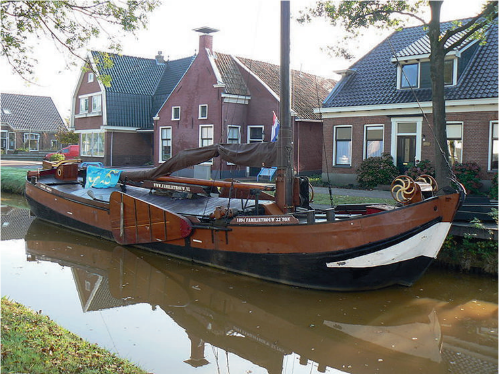
Parochiedag en bisschopswijding