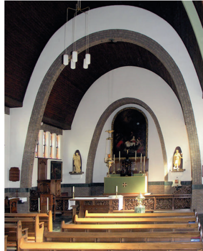
- Interieur van de oud-katholieke kerk van Sint-Joris in Amersfoort

Intussen komen er ook in parochies, naast de persoonlijke contacten via mail, telefoon of app, allerlei activiteiten op gang om elkaar vast te houden. Zo ook