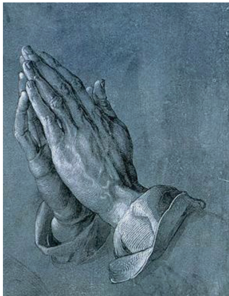
- Albrecht Dürer, Biddende handen (c. 1508)

Bemoedig hen die door het virus in quarantaine moeten leven,