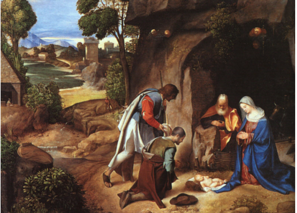
Giorgione, Aanbidding van de herders

Als iemand die ons lief is, ergens ver weg woont, dan stellen we er prijs op zo nu en dan eens een teken van leven te ontvangen. Zo alleen blijft die ander in ons bewustzijn, in ons hart, blijft die ons lief.