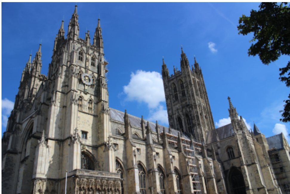
Anglicaanse kathedraal in Canterbury

Tijdens een vrij langdurig verblijf in Addis Abeba kwam ik in aanraking met de Anglicaanse Kerk aldaar. Het was een tijd dat ik, komende uit de ellende van Darfur, wel behoefte had aan een geestelijk 'thuis'. Daarnaast was ik, komende uit de gereformeerde traditie, kerkelijk al een tijdje zoekende. Een episcopale kerk bleek de weg die ik moest gaan. Maar in het noorden van Nederland was er, toen we ons daar in 2007 vestigden, geen anglicaanse gemeenschap. Na enig speurwerk kwam ik er echter achter dat de Anglicaanse Kerk en de Oud-Katholieke kerk al sinds de jaren '30 van de vorige eeuw een 'full communion' relatie hebben. Toen ik dan ook begin 2007 definitief uit Afrika terugkwam en ontdekte dat er in Jorwert af en toe op zaterdagavond