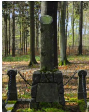
Graftombe van De Génestet © Marikit Louppen

En steekt de lampen aan – ook waar een zon van zegen Dees schoonen morgen, in uw woning, licht en lacht! Omgordt u: gij moet voort, op de onbekende wegen! Ontsteekt de lampen – het wordt nacht.