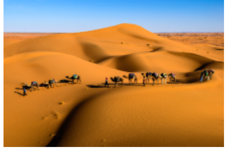
Karavaan in de woestijn

Hoe paarden door een polder draven, zonder hoogmoed, vrij van ziel, en drijven karavaankamelen naar een verre drinkplaats toe - met hun ootmoed, hun geduld. Zij het door woestijn, dan wel bijna water, strijd en moeite is het dat leven elkeen wel vermag. Berijders stromen op de voetslag voort de vrije verten in.