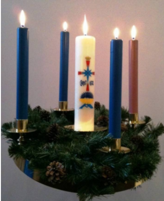
Adventskrans met paaskaars

Aan de horizon gloort het “hemelse licht”: