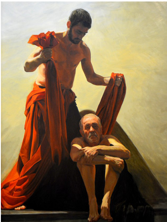
Sint-Martinus, Egbert Modderman

Er hangen nu vijf prachtige, indrukwekkende schilderijen in de kooromgang, die niet alleen een eenheid vormen door de thematiek, maar ook door het kleurgebruik. Veel blauw en zwart, tegen een sobere achtergrond. De personen zijn levensecht. Modderman gebruikt lokale modellen, mensen die je op straat tegen kunt komen en die hij inderdaad ook wel eens van de straat haalt.