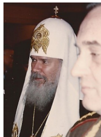
Beelden van een conferentie in Moskou in 1994. Vlnr. Het dansje in uniform, koffiepauze met collega's en een orthodox geestelijke, eregast en spreker Patriarch Alexey II