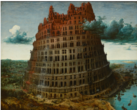
Pieter Breughel, De toren van Babel

Het gedicht zou nu geschreven kunnen zijn, al geeft Marsman aan dat de dreiging van twee kanten komt: in zijn tijd het nationaalsocialisme en het communisme, twee machten waartussen mensen klem komen te zitten. Babylon is een stad uit de oudheid; in de Bijbel wordt Babel geassocieerd met goddeloosheid en afgoderij. De toren van Babel, die gebouwd werd omdat mensen tot in de hemel wilden reiken, is een symbool van menselijke hoogmoed, de hoogmoed van tirannen: Napoleon, Hitler, Poetin.