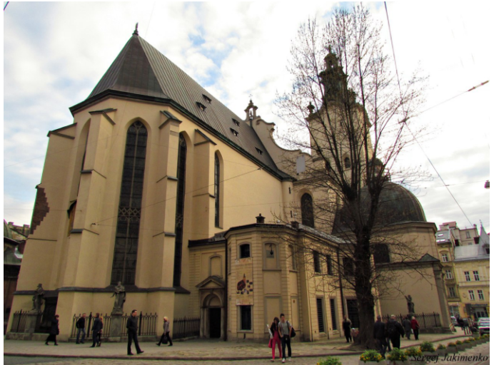
Latijnse kathedraal in Lviv

Nu Oekraïne in oorlog met Rusland is, fungeren de grafkelders bij luchtalarm als schuilplaatsen voor iedereen. Zal de Latijnse Kathedraal op het plein in het centrum van Lviv de Russische