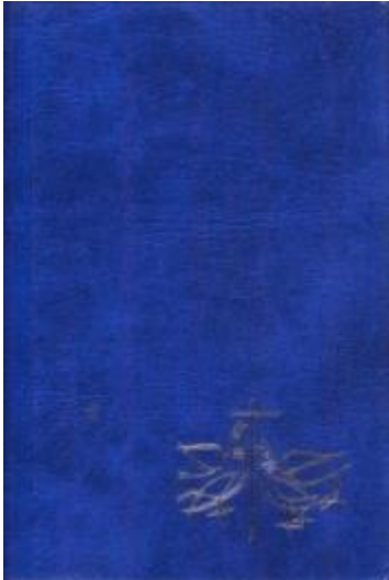
De buitenkant van het gezangboek