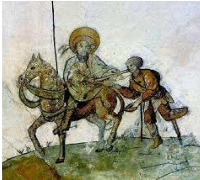
Gewelfschildering met Sint Martinus en de bedelaar in de oude parochiekerk van Groningen, de Martinikerk op de Grote Markt.

deelde, was een goede aanleiding om de beter bedeeden op hun christelijke roeping om te delen met hun medemensen te wijzen!