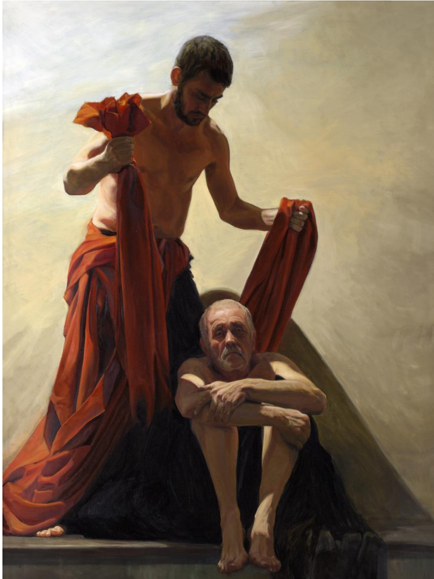
Modern schilderij van Sint Martinus die zijn mantel met de bedelaar deelt in de Martinkerk te Groningen door Egbert Modderman.