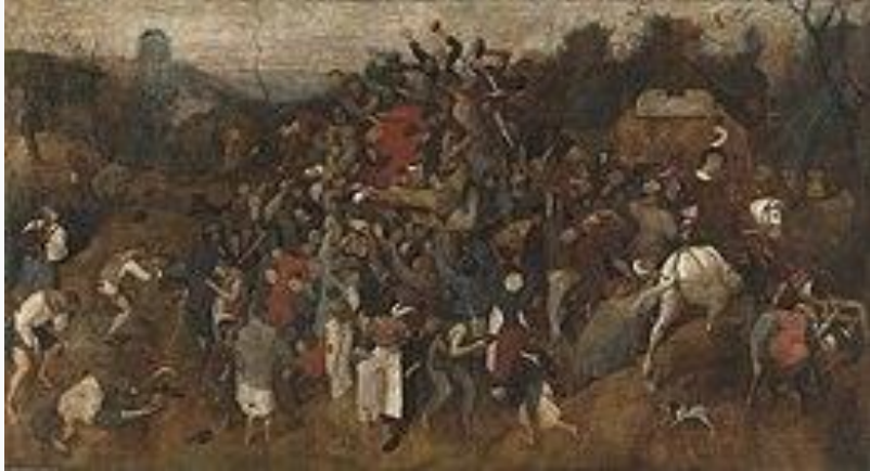
Weergave door Pieter Bruegels de Oudere van het Sint Maartensfeest (ca. 1566). Men dronk dan de nieuwe wijn. Tot in de 19e eeuw werd door kinderen gezongen: "Sint Martijn, Sint Martijn, t'avond most en morgen wijn!"