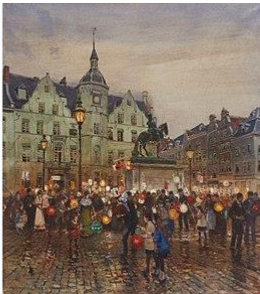
Ook in veel Duitse streken kent men de St. Maartensviering met een lampionoptocht. Hier in 1905 de viering van Sint-Maarten voor het stadhuis van Düsseldorf.

In het Evangelie van Lucas staat de tekst: Niemand steekt een lamp aan en zet die in de kelder of onder de korenmaat, maar op de standaard, opdat wie binnentreden het licht zien (Lukas 11:33 e.v.). Dit evangeliegedeelte werd vaak op 11 november in de kerkdiensten voorgelezen en daarna werd er daarover gepreekt. Dit zou voor de gelovigen aanleiding zijn geweest voor een lichtjesfeest.