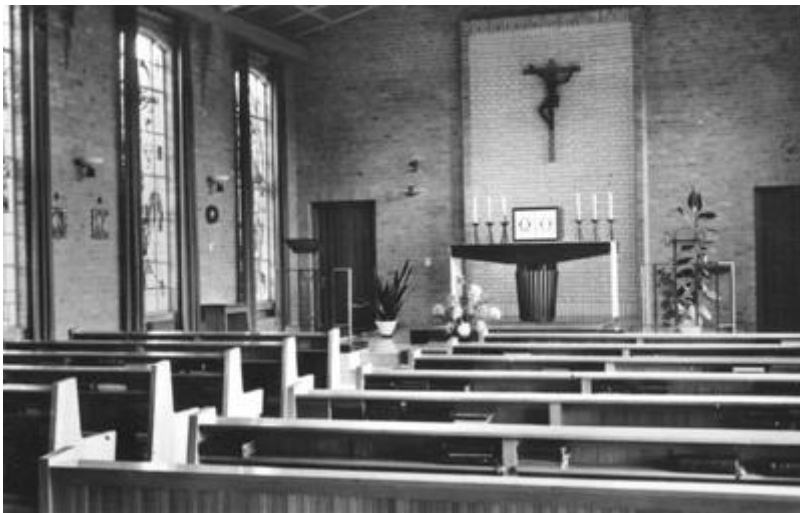
De mooie kapel aan de Merwedestraat met prachtige glas-in-lood ramen (helaas niet in kleur)

Op de grafsteen van Bas kijck staat: "Maar de goedheid van de Heer blijft."