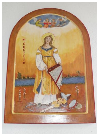
Icoon van Ste Caecilia in de Kerk van Lekkum waar onze kerngroep zijn vieringen houdt.

bankrekening parochie: NL12INGB0003941884 t.n.v. Oud-Katholieke parochie van de H. Martinus, Groningen.