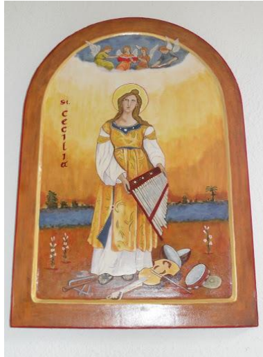
Icoon van Ste Caecilia in de Kerk van Lekkum waar onze kerngroep zijn vieringen houdt.