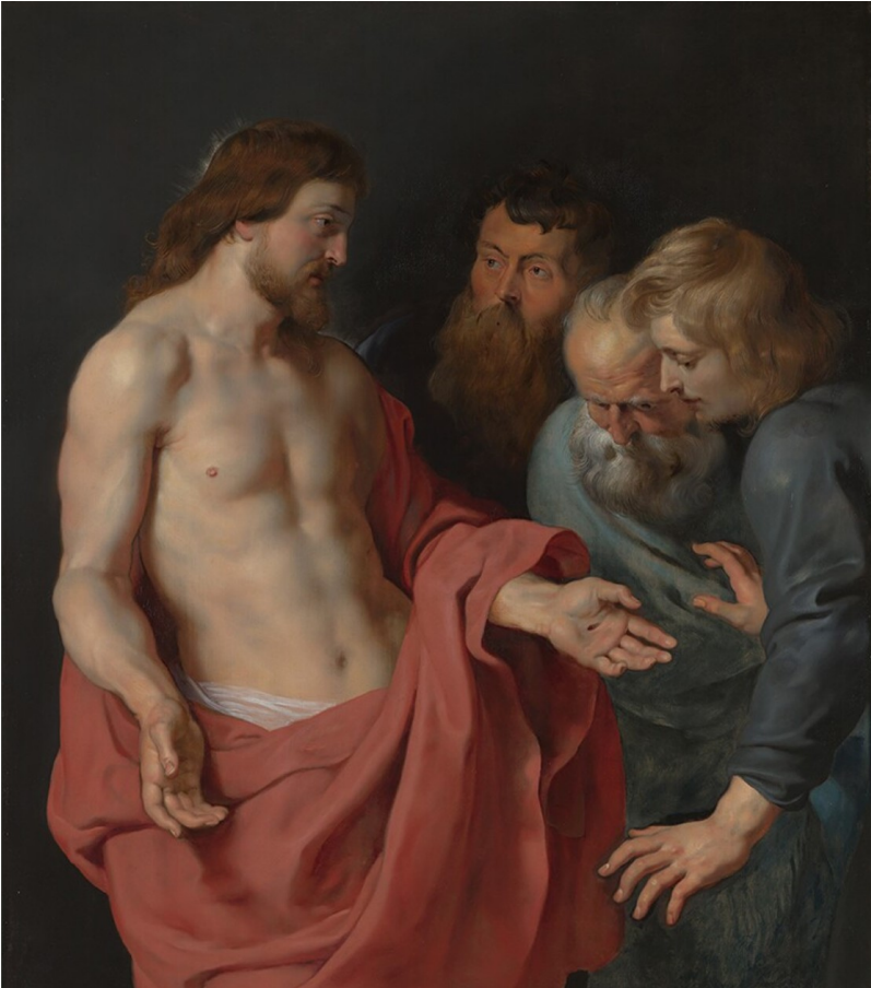
De (on)gelovige Thomas, schilderij van Peter Paul Rubens uit ca. 1613-1615.

Het bijzondere van dit schilderij is dat het niet zoals de meeste anderen met dit onderwerp de zijde-wond van Jezus en een daarheen met zijn vinger wijzende of zelfs aanrakende Thomas laat zien.