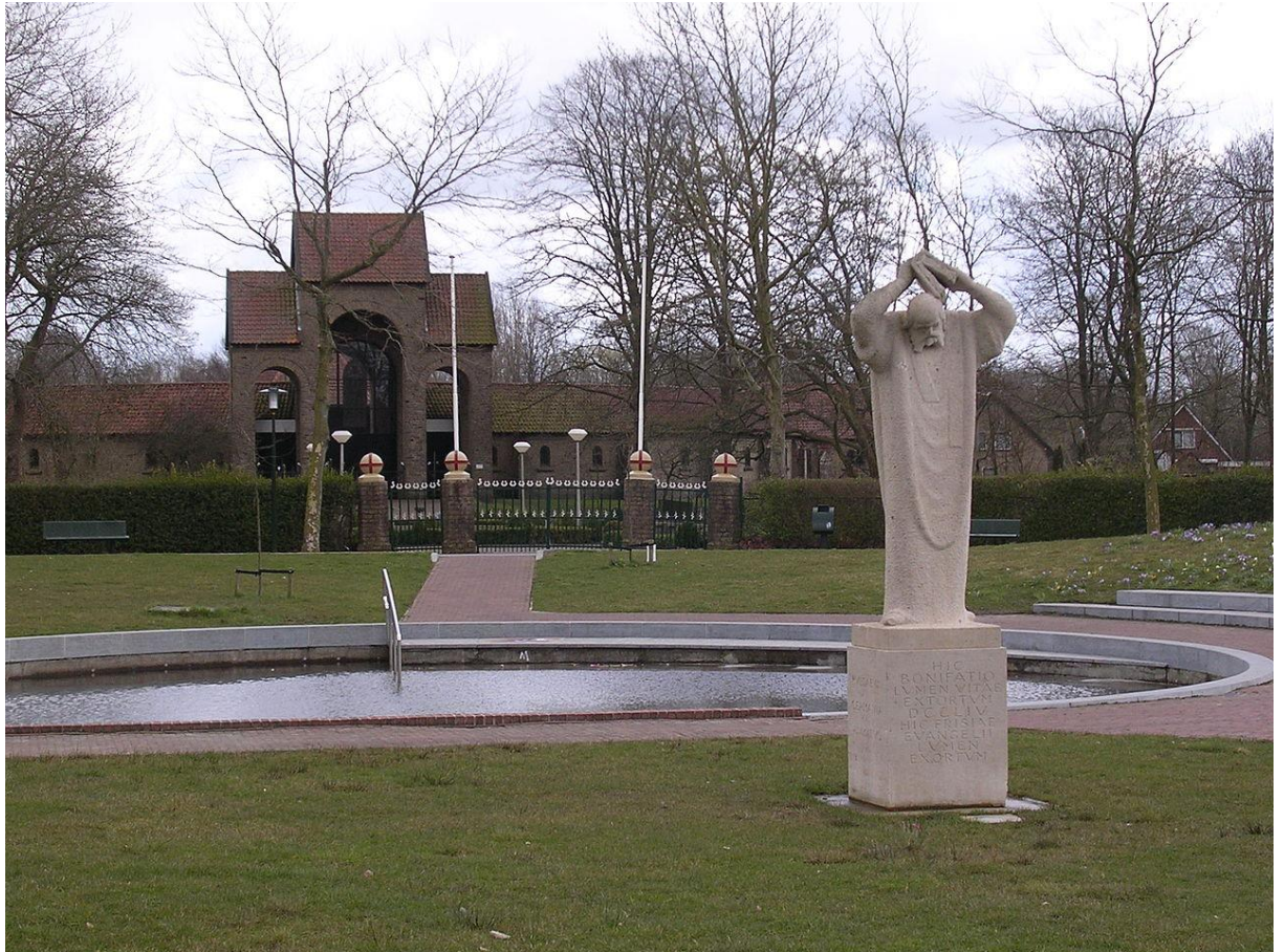
Bonifatiuskapel, Bonifatiusbron en standbeeld van Bonifatius in Dokkum.

Brandsma sterk bevorderd. In 1934 werd de Bonifatiuskapel gebouwd en in 1962 werd in Dokkum een standbeeld voor hem onthuld door de toenmalige prinses Beatrix. Brandsma was overigens ook de schrijver van een biografie van zijn ordegenote, de H. Theresia van Avila, patrones van onze Friese kerngroep.