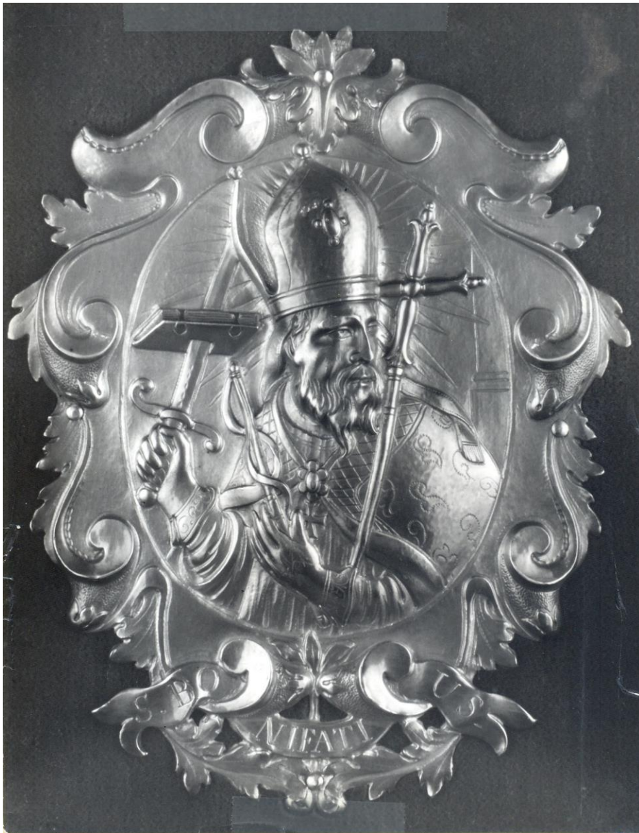
Bonifatius afgebeeld op het zilverbeslag van een altaarmissaal uit de oud-katholieke Paradijkerk in Rotterdam

vraagteken bij zijn grote verbondenheid aan de zetel van Rome! In de oud-katholieke parochiekerken die dateren uit de 17 e en 18 e eeuw – of in latere kerken waarin het meubilair uit de voorgangerkerk werd overgenomen – tref je bijna altijd in de buurt van het altaar bij elkaar horende beelden of schilderijen van Willibrord en Bonifatius, die gezien worden als de stichter van de christelijke kerk in ons land en die voor ons ten beste bidden bij de Heer, onze God.