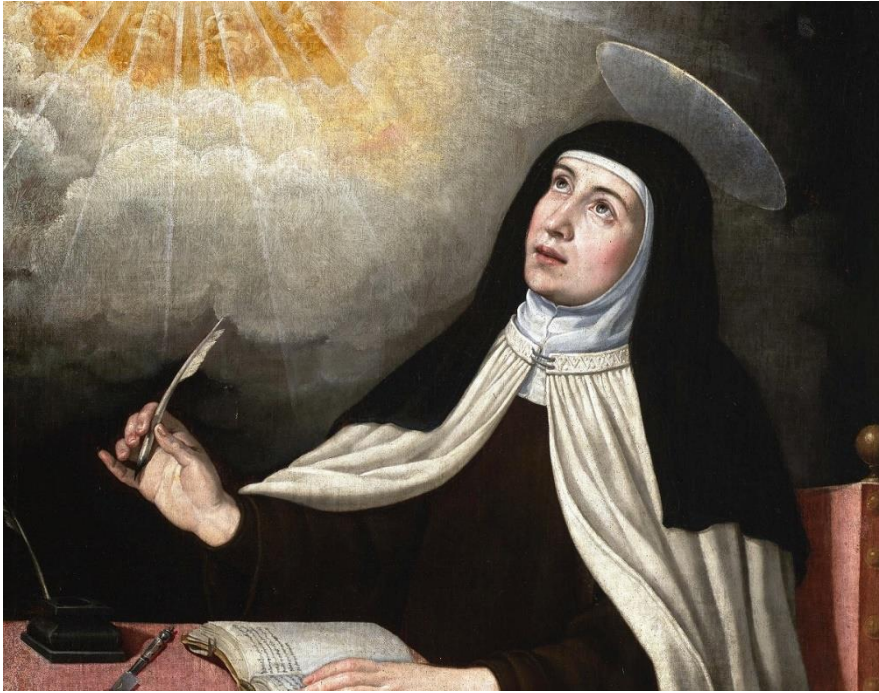
Theresia van Avila: terwijl zij schrijft, heeft Theresia een visioen

Net als in voorgaande jaren organiseren de Groningse binnenstadskerken weer een aantal doordeweekse bijeenkomsten waarbij iedereen welkom is. Ook onze parochie doet weer mee. Op dinsdag 18 juli hoop ik om, 10.00 uur in de gemeentezaal een lezing te houden met als titel “Theresia van Avila: een sterke vrouw, mystica en kerkhervormster uit de 16 e eeuw met een verhaal voor nu”. Er is daarbij ruim gelegenheid tot gesprek. Onze parochie heeft wat met Theresia van Avila , want zij is de patrones van onze kerngroep Friesland en wordt in de liturgie ook altijd samen met Sint Martinus als patronen van de parochie genoemd. De activiteiten in andere kerken zal ik in de komende parochiebrief opnemen.