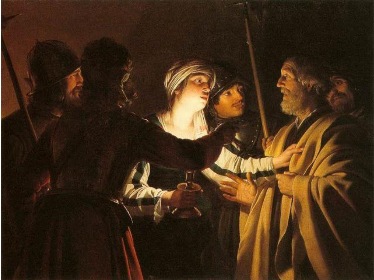
De verloochening door Petrus, Gerard Honthorst (1592-1656)

Dat zal zo zijn. Want dat is de nieuweid van Pasen! Petrus verloochende zijn Heer op een ontstellende manier. Vloekend en zwerend had Petrus terwijl Jezus voor de Hoge Raad terecht stond, zijn eigen hachje willen redden: "Ik ken die mens niet, over wie jullie spreken."