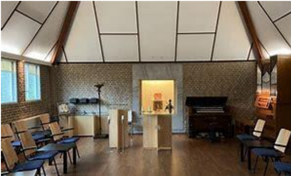
Lebuïnuskerk te Hengelo