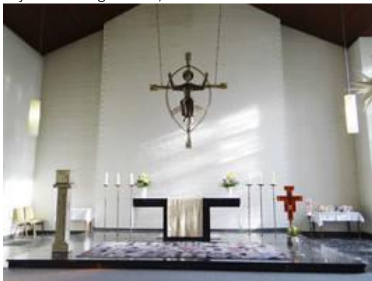
De Lutherkirche in Wilhelmshaven waar de Oud-Katholieken vieren.