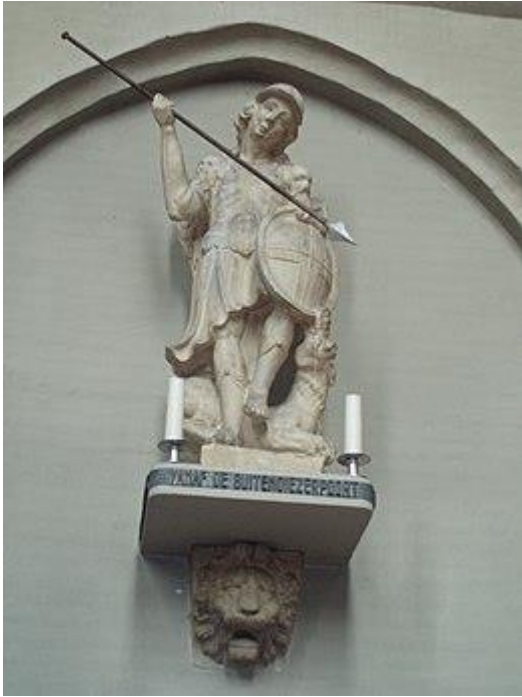
Michaël vecht tegen de draak (basiliek van OLV in Zwolle, de kerk achter de "peperbus").

Sommige beelden geven hem ook een schild in handen met erop de tekst: Quis ut Deus . Dat is de Latijnse vertaling van de Hebreeuwse naam Mi-ka-eel ("Wie is als God).