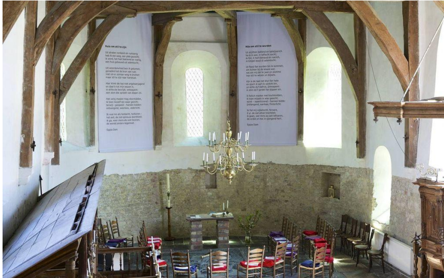
De altaartafel in de St Radboudkerk te Jorwert

Ik had het kunnen weten, want ik heb verscheidene malen in Engelbert en Jorwert dienst gedaan! Nadat de kerk van Engelbert voor onze huidige kerk werd verlaten, is de ambo daar nog wel even gebruikt, maar het altaar niet.