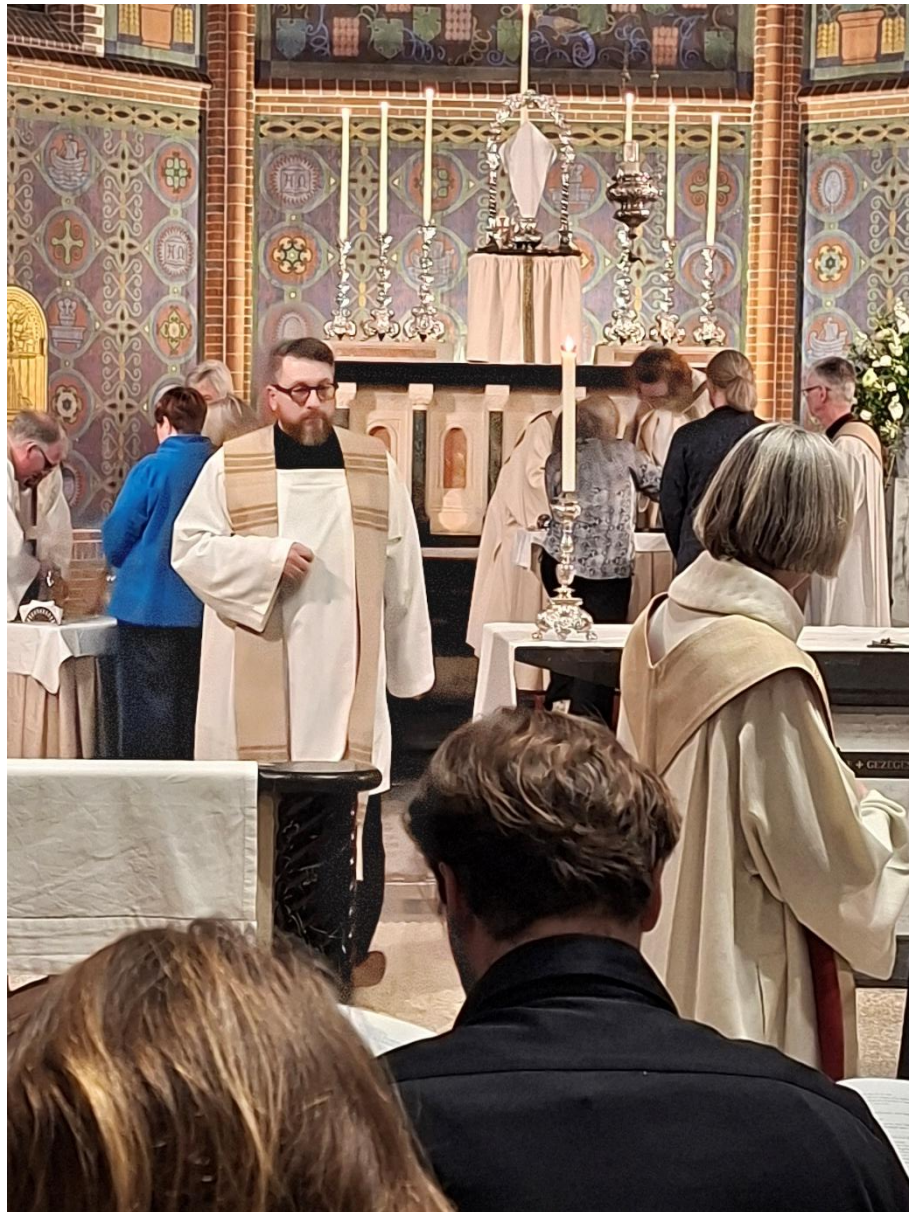
Uitdeling van de heilige oliën tijdens de Chrismamis