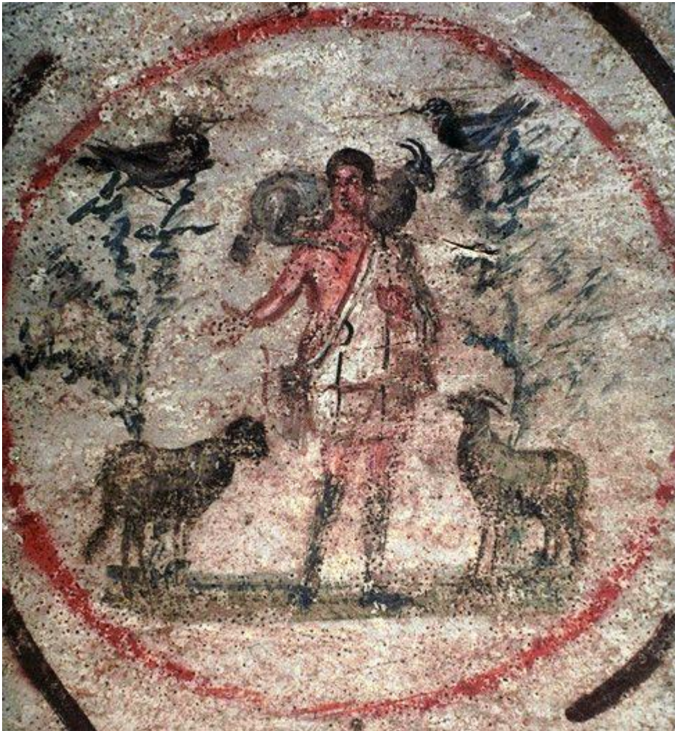
één van de oudste afbeeldingen van Jezus als de goede herder,

(2 e helft 3 e eeuw) catacomben van Priscilla, Rome