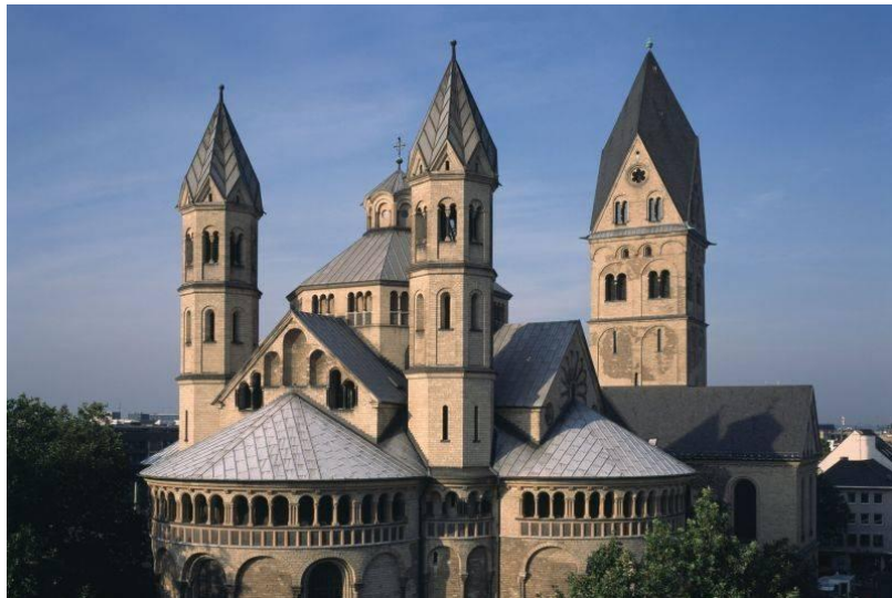
Sankt Aposteln, nu

Ze zijn in al hun herrezen pracht, een herinnering aan wat nationalisme en rassenwaan teweeg hebben gebracht, aan oorlogsgeweld, aan ontmenselijking en vernietiging en tegelijk verwijzen ze al de eeuwen van hun bestaan al door naar het hemelse Jeruzalem, de Stad van de vrede. De hymne van het feest van kerkwijding bezingt het kerkgebouw als beeld van het nieuwe Jeruzalem