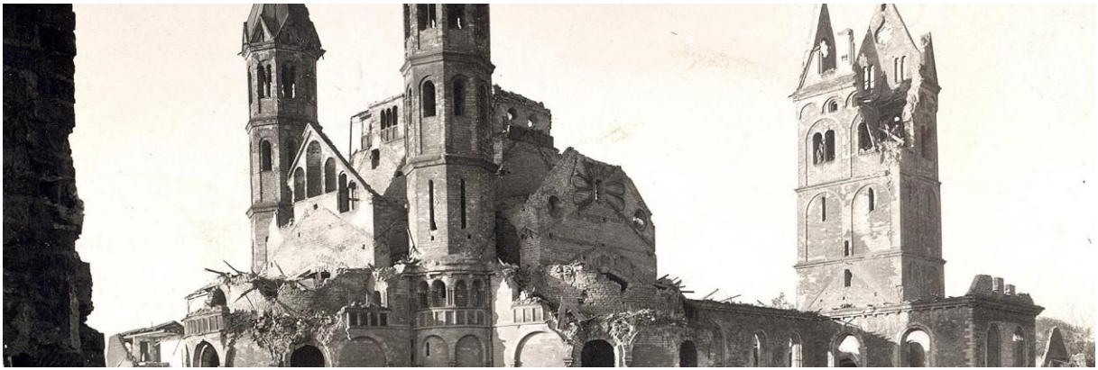
Sankt Apostln, Keulen, 1946

middeleeuwse Romaanse kerken. De Romaanse vorm van kerkarchitectuur spreekt mij bijzonder aan en Keulen is daarmee rijk gezegend. Bijna al die kerken zijn na de zware schade die ze in de Tweede Wereldoorlog hebben opgelopen, weer herbouwd.