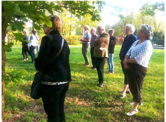
Deelnemers aan de kruiswegstatie

Bloed vloeit Door ons veroorzaakt Liefdeloos zijn wij Vol erbarmen neemt Hij ons kruis Aanvaardt Zijn lot