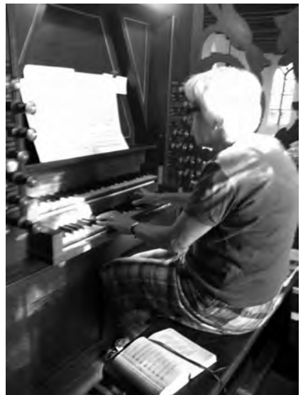
Albertba in actie