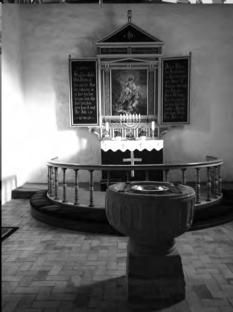
Voorbeelden van kerkinrichting, details uit kerken in Denemarken