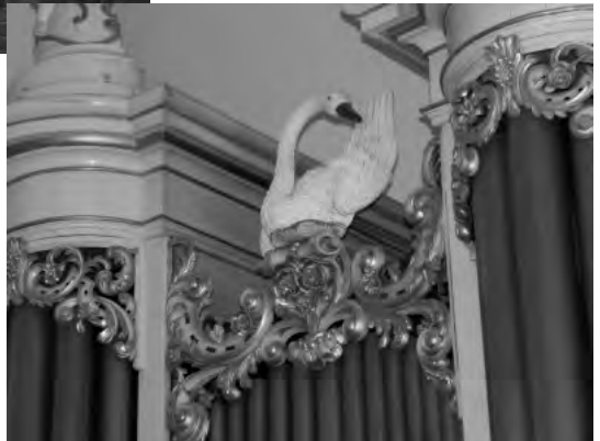
Detail van het orgel