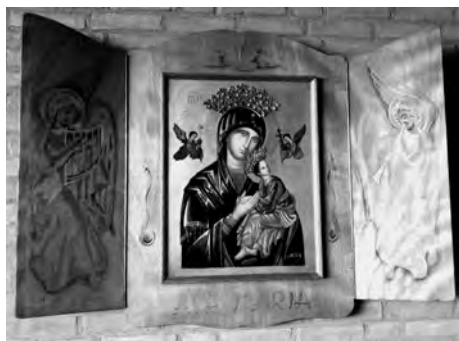
drieluik 'Ave Maria', uit het klooster van Wahlwiller

P.S. 's Avonds werd dit drieluik fantastisch verlicht door de ondergaande zon.