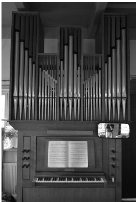
Eddy Ufkes & Astrid Zomervrucht