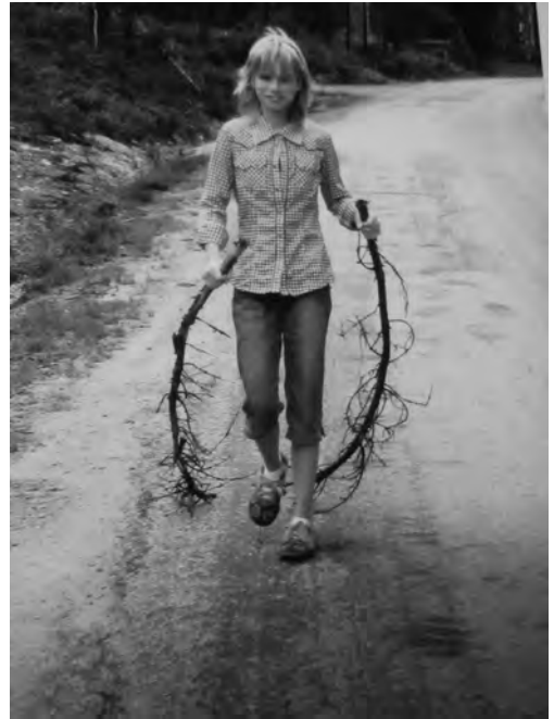
Op vakantie in Zweden (2007): 'nordic walken'

tussen cultuurwetenschap, kunstgeschiedenis en filosofie is er een waar ik veel plezier in heb en waar ik me graag ook nog lang in wil verdiepen. Daarnaast lees ik ook altijd graag en kijk ik ook graag films.