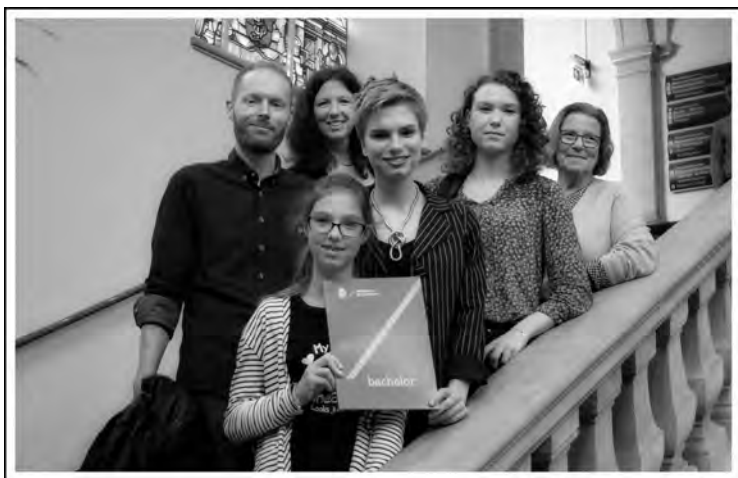
2017:mijn bachelorbull! Op de foto in het Academiegebouw met vriend, moeder, vriendin, oma en zusje