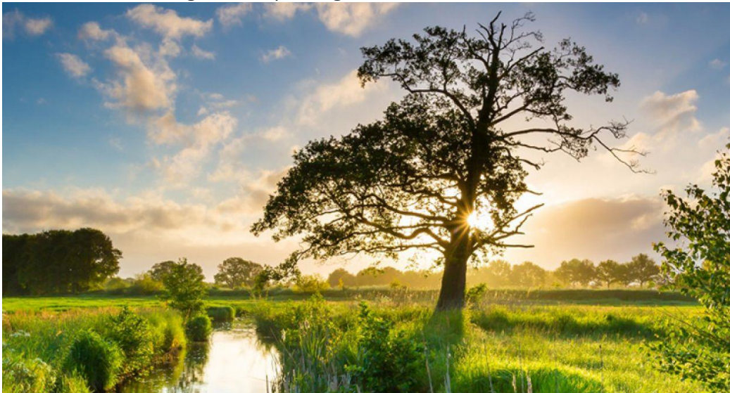
De Ruiten-A bij Smeerling

Het vlakbij gelegen Metbroekbos is een restant van de oerbossen van Westerwolde, met bijzondere planten en dieren en bomen van meer dan 200 jaar oud. Om te bewandelen is Het Beleefpad in Smeerling, een pad dat je terugbrengt naar de natuur van vroeger. Je komt langs de meanderende beek de Ruiten-A (met ooievaarsnesten), de kruidenrijke akkers en de weilanden. Het pad is toegankelijk voor wandelaars, maar ook voor mensen die minder mobiel zijn, met rolstoel of rollator, voor kinderen, voor mensen met een visuele beperking of mensen met een gehoorbeperking.