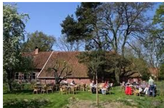
De theeschenkerij waar je zowel buiten als binnen kunt zitten

ca. 15.15 uur - Afsluiting: theeschenkerij Gasterij Natuurlijk Smeerling