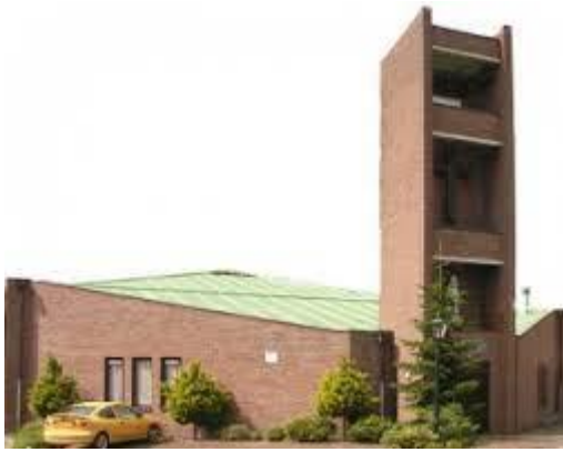
St. Bonifatiuskerk in Nieuwe Pekela