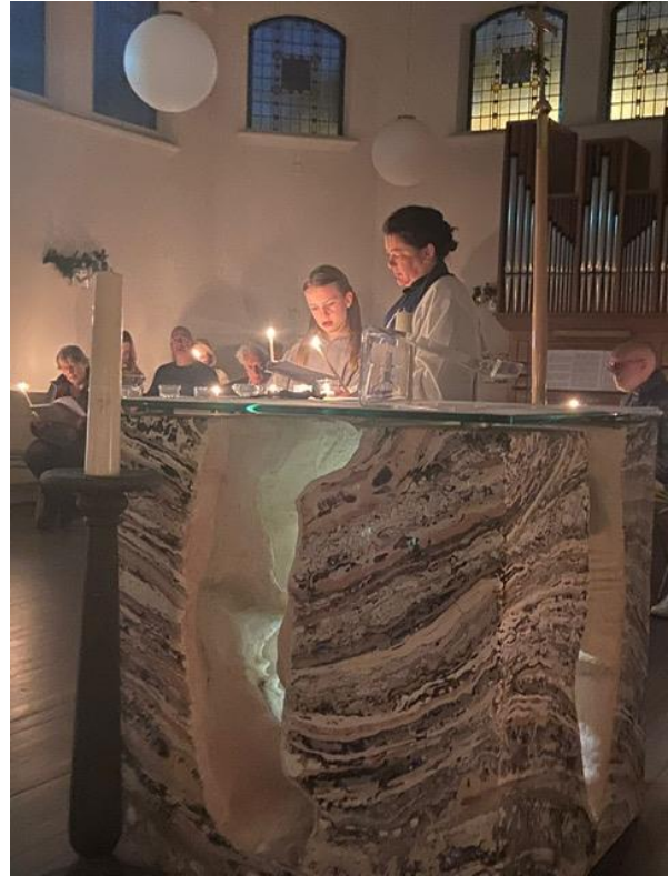
De lezing van het scheppingslied uit Genesis wordt na iedere scheppingsdag onderbroken, door het zingen van het refrein: "En God zag dat het goed was, dit was de .... dag", tegelijkertijd wordt er iedere keer een nieuw licht op de altaartafel ontstoken.