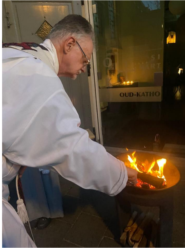
Een bundeltje kaarsen wordt in het nieuwe vuur aangestoken, hiermee zal de Paaskaars worden aangestoken.