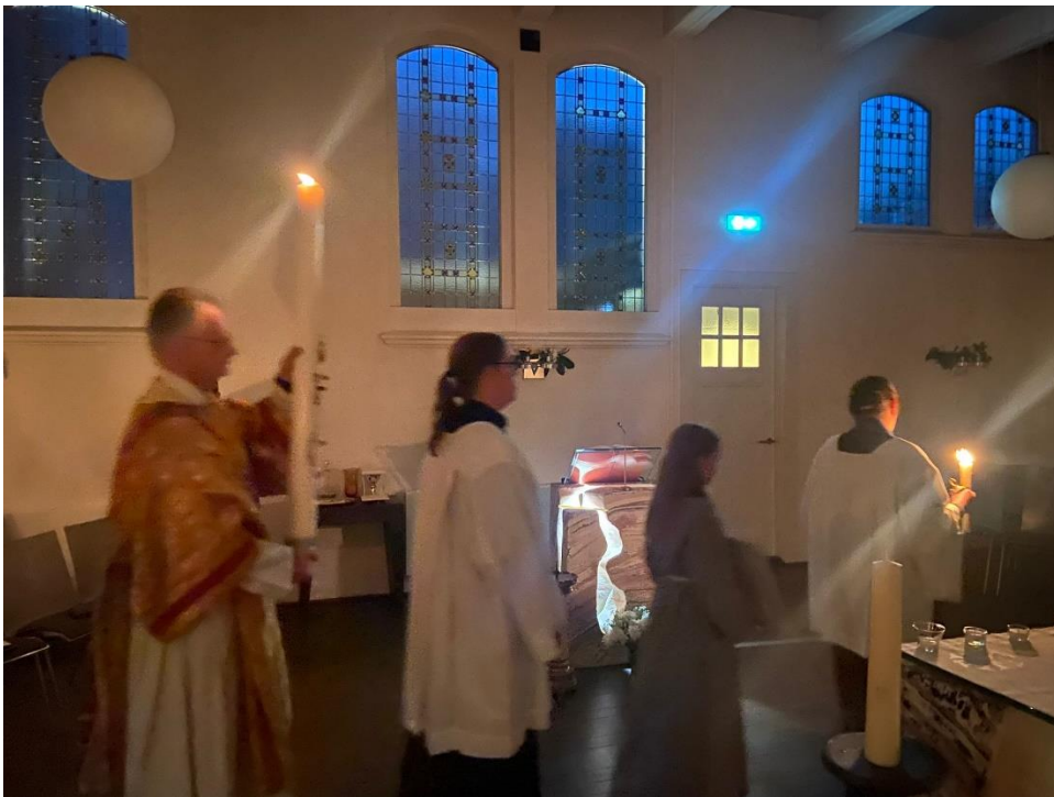
Vooraf gegaan door de misdienaren wordt de Paaskaars de lege kerk in gedragen.