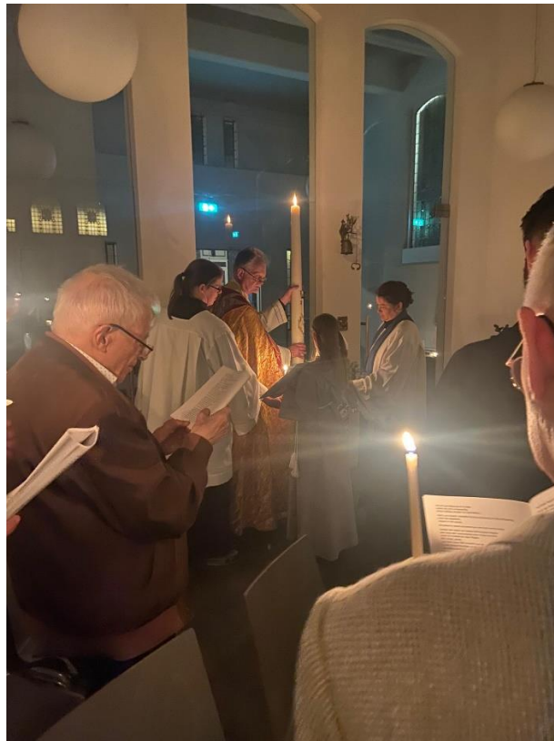
Bij de zegening van het nieuwe doopwater, wordt de Paaskaars driemaal in de doopvont gehouden.