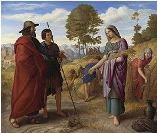
Julius Schnorr von Carolsfeld (1794-1872)

Ook Boaz is een toonbeeld van trouw, van iemand die liefdevolle daden verricht zonder een beloning te verwachten. Als hij bij zijn maaiers komt kijken, ziet hij Ruth, de buitenlandse weduwe. Boaz was verplicht om armen en weduwen aren te laten lezen. Maar hij gaat een stap verder: hij heet haar hartelijk welkom, geeft haar ruimschoots te eten en te drinken en zegt zelfs tegen de maaiers dat ze extra koren op het land moeten laten liggen.