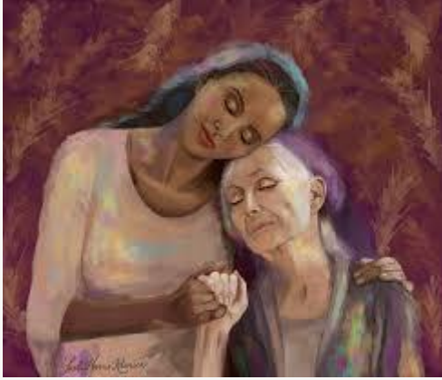
Ruth en Naomi

Boaz zegt daarover: 'Moge de HEER je zegenen, mijn dochter. Dit getuigt van nog meer trouw dan wat je voorheen al hebt gedaan' ( Ruth 3:10 ).