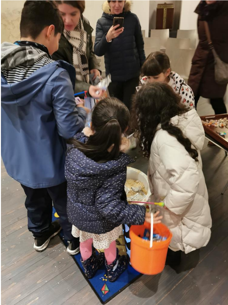
De grabbelton in de kerk

solo een heel lang Martinuslied zong, waarvan haar vader absoluut niets verstond! Nadat ik het verhaal van Sint Maarten had verteld, kregen de kinderen namens onze parochie snoep uitgedeeld. Met de herinnering van vorig jaar nog in het geheugen had ik daar dit jaar maar geen mandarijnen bij gedaan. Kinderen willen gewoon – ongezond of niet – snoep! Na hun tocht door de wijk kwamen ze nog weer terug. Op bepaalde adressen hadden ze namelijk een muntje gekregen, dat hun het recht gaf om in een grabbelton naar een cadeautje dat de buurtvereniging ter beschikking had gesteld te graaien.