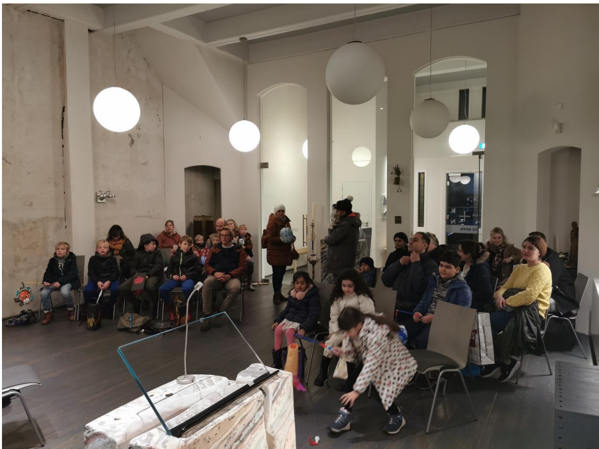
Kinderen en hun begeleiders op 11-11 in afwachting van het Martinusverhaal in de kerk

Dit jaar vierden we als parochie niet de feestdag van onze patroon Sint Martinus. Op de daarvoor in aanmerking komende zondag vierden namelijk onze Anglicaanse zusters en broeders in onze kerk. Dat wil niet zeggen dat Sint Martinus in onze parochie ongemerkt voorbij is gegaan. Net als in de voorgaande jaren organiseerden wij samen met de buurtvereniging Zeeheldenkwartier de start van de Sint Maartenstocht in onze Sint Martinuskerk. Op 11 november was rond een uur of vijf onze kerk geheel gevuld met kinderen uit de Zeeheldenbuurt en hun begeleiders.