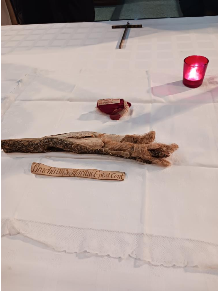
Relieken van St Martinus op 1 november op het altaar van de Ste Gertrudiskathedraal