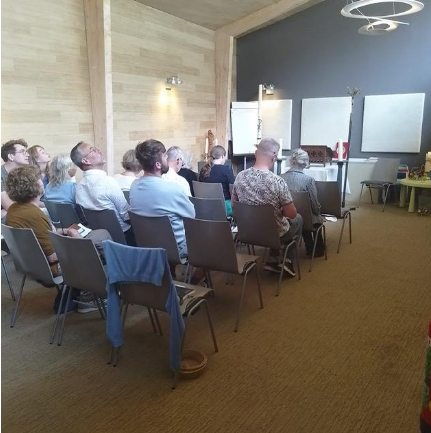
30 juni: nog niet iedereen op zijn of haar plaats, maar de gemeentenzaal is klaar voor de dienst.

Vorige week schreef ik dat ook al was de kerkzaal als vieringruimte niet beschikbaar, dat dat toch een koor - Kooriander – niet weerhield om haar voornemen om op 30 juni in de kerk zijn zomerconcert te houden, te laten doorgaan. En dat hebben ze gedaan. Hieronder een foto van de “ingepakte” kerkzaal, waar al wat stoelen klaar staan voor het concert.